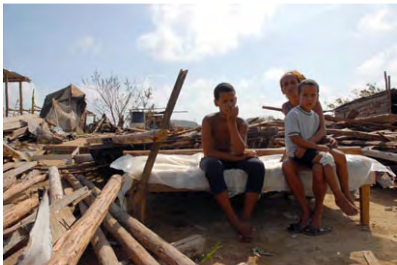
Los huracanes que azotaron a Cuba en el 2008 abrieron las puertas a una historia de alianzas entre el PMA y la AECID.