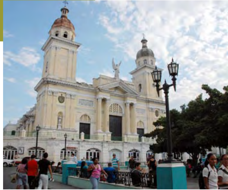
Santiago de Cuba está considerada la segunda ciudad en importancia de la isla y dista unos 860 kilómetros de la capital.

“Una de las tres líneas en que se propone el desarrollo del programa es el rescate de las mini industrias procesadoras en los municipios del territorio. Santiago es una potencia en la producción frutícola y la idea es procesarlas cerca de donde se producen, para que no se pierdan; envasarlas a granel y que lleguen a la gran industria ya en forma de pulpas”, detalló Magdariaga a AECID.CU .