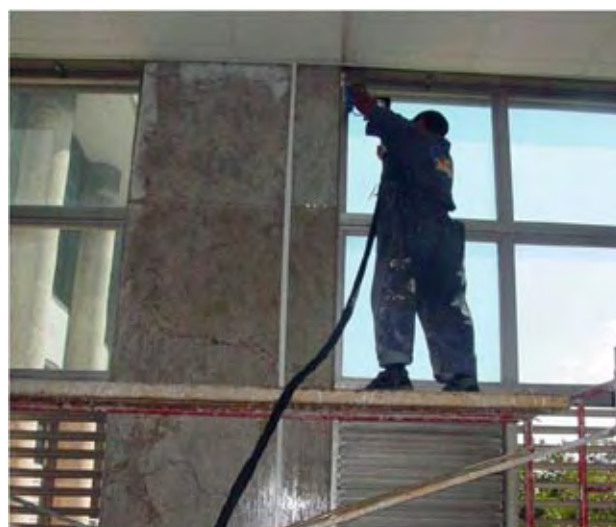
Pulido de mármoles.

En otra apuesta a la salvaguarda del patrimonio, la Sala Infantil y Juvenil “Eliseo Diego” se trasladan a la biblioteca ubicada en las calles Calzada y Ocho, de la céntrica zona habanera de el Vedado, donde radica también la Casa de Cultura del municipio de Plaza de la Revolución. “Las Bibliotecas Nacionales