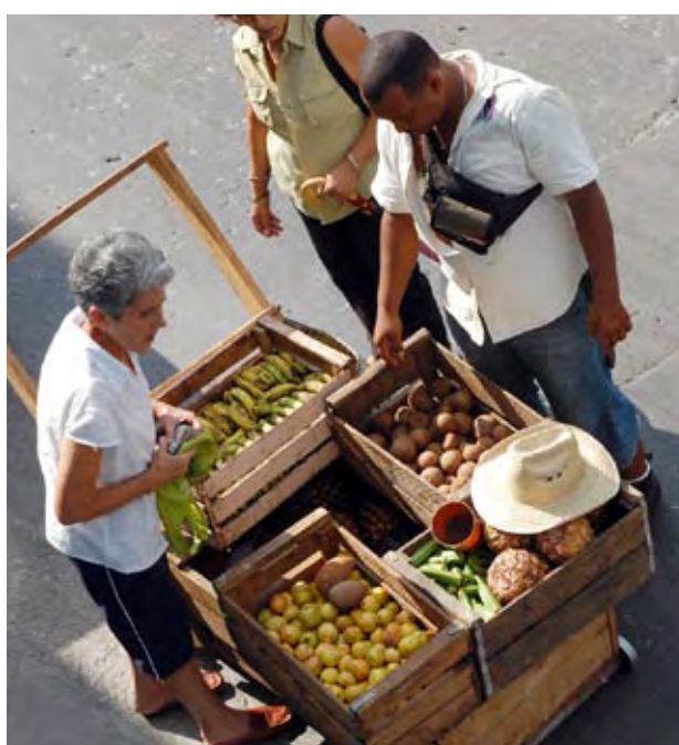
Fortalecer el procesamiento local de las abundantes producciones de frutas santiagueras es objetivo del Programa Oriente Rural.

A nivel institucional, será fortalecido el trabajo de los gobiernos provinciales y municipales; del Instituto de Planificación Física y las dependencias de los Ministerios de la Agricultura, el Azúcar, la Industria Alimentaria, el Turismo o la Industria Ligera, entre otros. Asimismo, recibirán respaldo empresas diversas del territorio, cooperativas agropecuarias, asociaciones y organizaciones sectoriales de la sociedad civil.