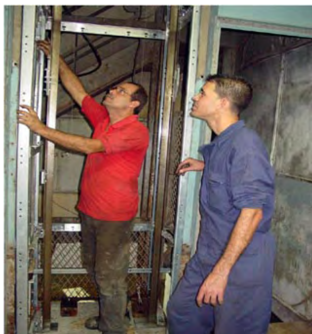
Nuevos montacargas harán más eficiente el servicio bibliográfico de la institución.

lo que implica la Biblioteca Nacional para el contexto cultural cubano.