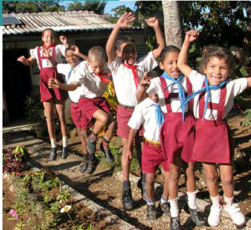
Niñas y niños cubanos están entre los beneficiarios del Programa Conjunto de apoyo a la lucha contra la anemia.

“Fue una ayuda muy importante, porque transportar alimentos tiene un costo elevado. Con la AECID