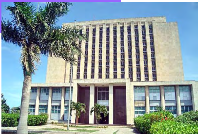
Ubicada en la antológica Plaza de la Revolución, en La Habana, la Biblioteca Nacional “José Martí” es depositaria del patrimonio documental, bibliográfico, artístico y sonoro del país.

Aunque la estudiante no lo sabía, la Biblioteca Nacional de Cuba cerró sus puertas al público desde el pasado 11 de abril, no solo para reconstruir la edificación, sino también para reordenar y restaurar sus ricas colecciones, con el apoyo de la Agencia Española de Cooperación Internacional para el Desarrollo (AECID) y la Consejería Cultural de la Embajada de España en Cuba.