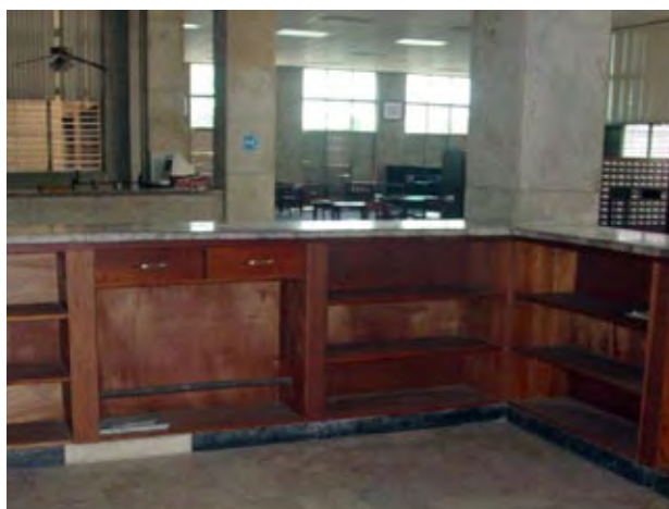
Los nuevos muebles reproducirán los que la Biblioteca tenía en el momento de su inauguración en el año 1901.