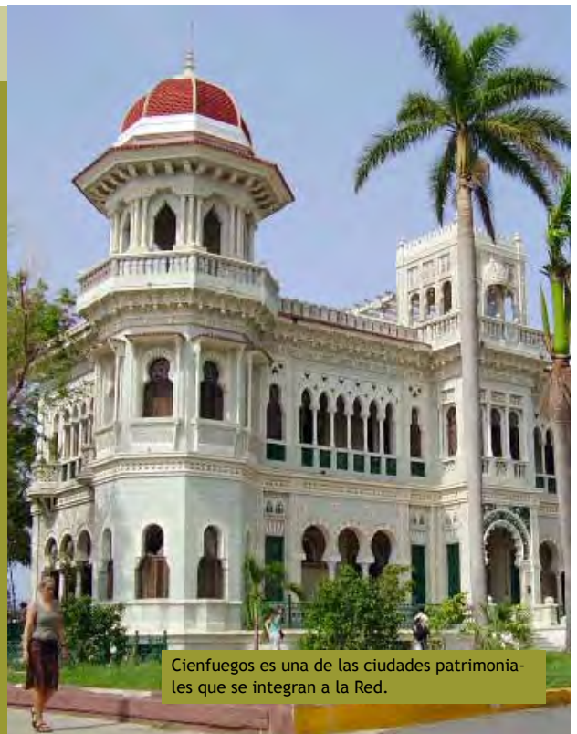
Cienfuegos es una de las ciudades patrimoniales que se integran a la Red.

La iniciativa, que tendrá en cuenta otras experiencias internacionales en este terreno, incluirá además la divulgación de sus resultados mediante un portal de internet, boletines electrónicos y otras publicaciones. Asimismo, tiene en cuenta la adquisición de equipamiento informático, talleres temáticos de contenido de la Red de Oficinas del Historiador y del Conservador de Cuba, cursos de capacitación y participación en eventos internacionales