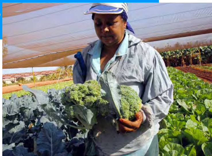
Visibilizar la labor de las mujeres en los espacios agropecuarios fue también objetivo de la ACPA.

Justo en busca de caminos para borrar esas y otras inequidades nació el proyecto “Fortalecimiento institucional para la implementación de una estrategia de género en cooperativas agropecuarias”, ejecutado por la ACPA y las organizaciones no gubernamentales Mundubat y ACSUR Las Segovias, con financiamiento de la Agencia Española para la Cooperación Internacional y el Desarrollo (AECID) y la Comunidad Autónoma de Murcia.